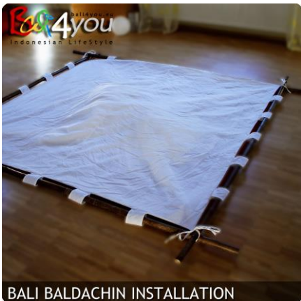
BALI BALDACHIN INSTALLATION

Il baldacchino si monta con poche manovre