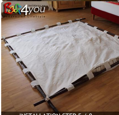
INSTALLATION STEP 5 / 8