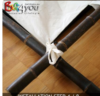
INSTALLATION STEP 4 / 8