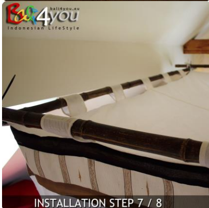
INSTALLATION STEP 7 / 8