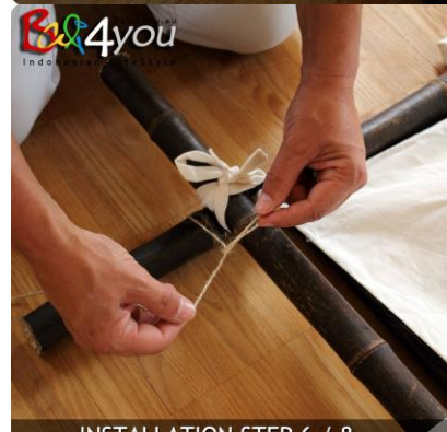
INSTALLATION STEP 6 / 8