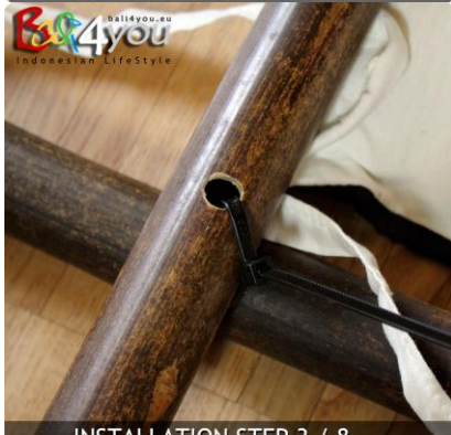
INSTALLATION STEP 3 / 8