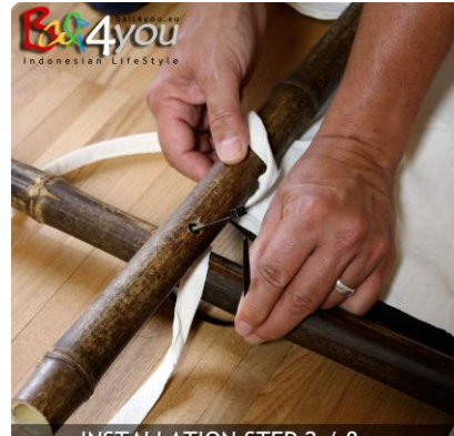
INSTALLATION STEP 2 / 8