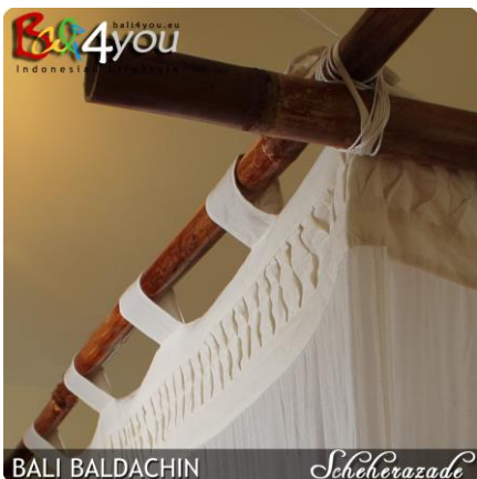
BALI BALDACHIN Scheherazade Figura 1 - Installazione del baldacchino