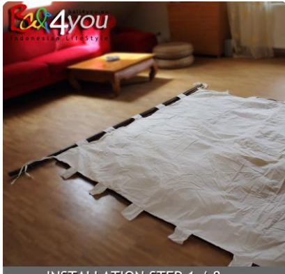
INSTALLATION STEP 1 / 8